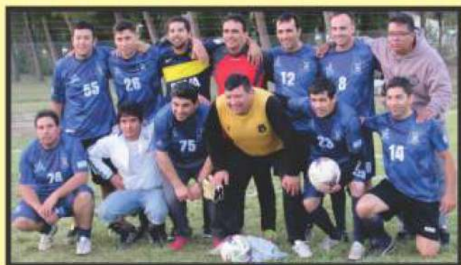
LA BANDA DEL TANQUE